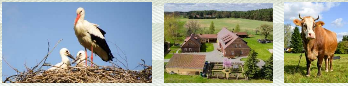
Impressionen aus dem näheren Umfeld vom Hof