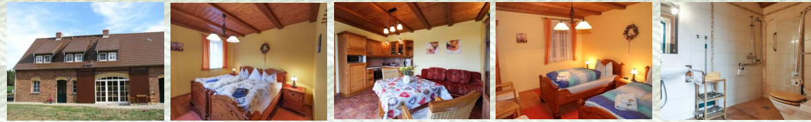
FeWo Kranich für 1–2 Personen · auch behindertengerecht · 40 m 2 · mit 1 Schlafräum, 1 Bad, 1 Wohnraum: Betten variabel als Doppelbett oder 2 Einzelbetten gestellt

Alle FeWo gehobener Komfort · Nichtraucherhaus · SAT/TV · Internetanschluss (WLAN) · Geschirrspüler · Mikrowelle · Kaffeemaschine · Wasserkocher · Toaster · Fußbodenheizung · Sitzgruppe · im Freien für jede FeWo · Gartengrillhaus · Spielplatz mit Sandkasten, Schaukel, Kletterturm und Trampolin · Streicheltiere: Kaninchen und Katzen für Kinder · Kleinkindausstattung · schöner Blumen- und Kräutergarten · Liegewiese · Lagerfeuerstelle · Fußball auf grüner Wiese · Volleyball · Tischtennis · Parkplatz