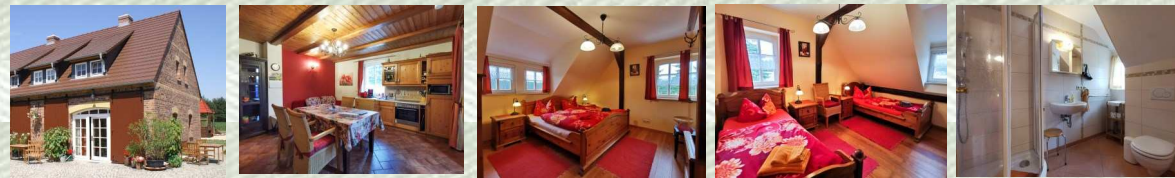
FeWo Schwalbe für 2–4 Personen · 55 m 2 · mit 2 Schlafräumen im OG, 2 Bäder im OG, 1 Bad mit WC u. WB im EG, 1 Wohnraum