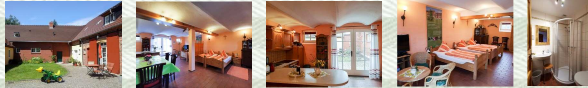
FeWo Bauernstübel für 1–3 Personen · 48 m 2 · große Einraumwohnung 2 kleine Bäder, Betten können variabel gestellt werden, kleine Sauna gegen Gebühr!