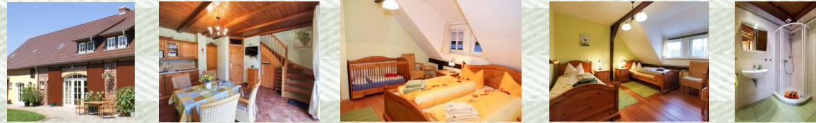
FeWo Laubfrosch für 2–4 Personen · 55 m 2 · mit 2 Schlafräumen im OG, je 1 Bad im EG/OG, 1 Wohnraum